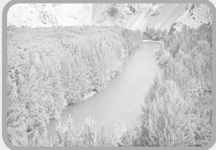
رودخانه زاینده‌رود در شهرستان بن و سامان این استان چهارمحال‌وبختیاری جریان دارد و زیبایی گذر این رودخانه پهناور از میان درختان گردو و چنار سرر به‌فلک‌کشیده که هم‌اکنون به رنگ‌های قرمز، نارنجی و زرد هستند، مسافران و گردشگران بسیاری در این منطقه حیرت‌زده کرده است. زیبایی این مناطق موجب شده که ورود مسافران در روزهای تعطیل به شهرستان سامان افزایش یابد. مسافران با گرفتن عکس‌های سلفی و گذاشتن در پیج‌های شخصی و کانال‌های ارتباطی عمومی موجب شهرت بیشتر این منطقه در سطح کشور شده‌اند و همین امر نقش مهمی در افزایش ورود مسافران به منطقه داشته است.مسافران بسیاری در فصل‌های مختلف سال برای مشاهده زیبایی‌های رودخانه زاینده‌رود و پل‌های تاریخی این منطقه به شهرستان سامان سفر می‌کنند. این شهرستان به‌طور میانگین در هفته میزبان یک‌هزار علاقه‌مند به ورزش رفتینگ است. چهارمحال‌وبختیاری در زمینه گردشگری ورزشی از جمله رفتینگ، بانجی‌جامپینگ، پاراگلایدر و صخره‌نوردی که در گروه ورزش‌های مهیج قرار دارد، قابلیت‌های منحصربه‌فردی دارد و این استان برای نخستین بار در کشور محل اجرای رفتینگ بوده است. لازم به گفتن است که تلاطم آب این رودخانه بسیار زیاد بوده و لازم است تدابیر ایمنی در حین قایق‌سواری لحاظ شود.

وی بیان کرد: برخی بانوان منطقه نیز با فروش محصولات فراوری‌شده انار و فروش صنایع‌دستی به مسافران در این منطقه کسب درآمد می‌کنند. جاده ورودی روستای دورک اناری در بالای دره‌ای قرار دارد که رودخانه ارمند از پایین آن می‌گذرد و همین امر سبب شده است عرض جاده بسیار کم باشد و امکان تردد اتوبوس در این منطقه فراهم نباشد. جشنواره انار در این منطقه طی روزهای آینده برگزار می‌شود و برگزاری برنامه‌های مختلف ازجمله بازی‌های بومی محلی، آوازهای محلی و… در کنار این جشنواره برنامه‌ریزی شده است. این امر فرصت بسیار مناسبی برای سفر به این منطقه به‌شمار می‌رود تا سفر مسافران را لذت‌بخش‌تر کند. خدمات اینترنتی در منطقه دورک اناری از یک‌ماه گذشته ارتقا یافته و این روستا از اینترنت بهره‌مند شده است. مسافرانی که قصد سفر به روستای دورک اناری را دارند، می‌توانند از دو مسیر به این منطقه سفر کنند. مسافران در مسیر اول می‌توانند ابتدا به شهر کرد و سپس به شهر ناغان بروند و از منطقه ناغان وارد منطقه دورک اناری شوند. همچنین می‌توانند به شهرستان لردهگان سفر کنند و از منطقه معروف «سه‌راهی ارمند» وارد روستای دورک اناری شوند.